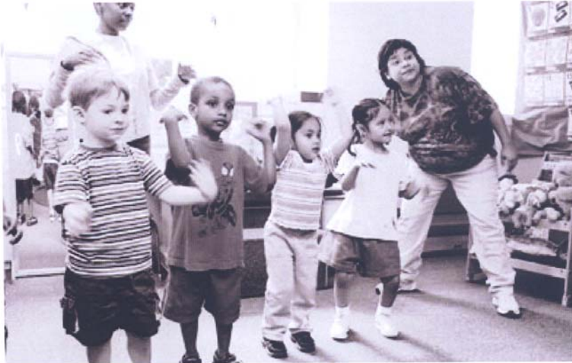
Además de leer estos niños del Centro Rosemount se divierten con una de sus instructoras.

Un estudio hecho por el Departamento de Educación de Estados Unidos encontró que el 61 por ciento de las familias de bajos recursos no tienen libros en casa para sus hijos. Noventa por ciento de los niños en Rosemount (nueve de cada diez) vienen de familias de bajos recursos y 70 por ciento de familias inmigrantes, la mayoría latinos.